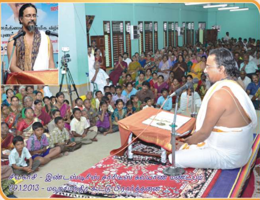
சிவகாசி - இண்டஸ்டிரிஸ் சுகரிடீஸ் கல்யாண மண்டபம் 29.1.2013 - மஹாமந்திர கூட்டு பிரார்த்தனை