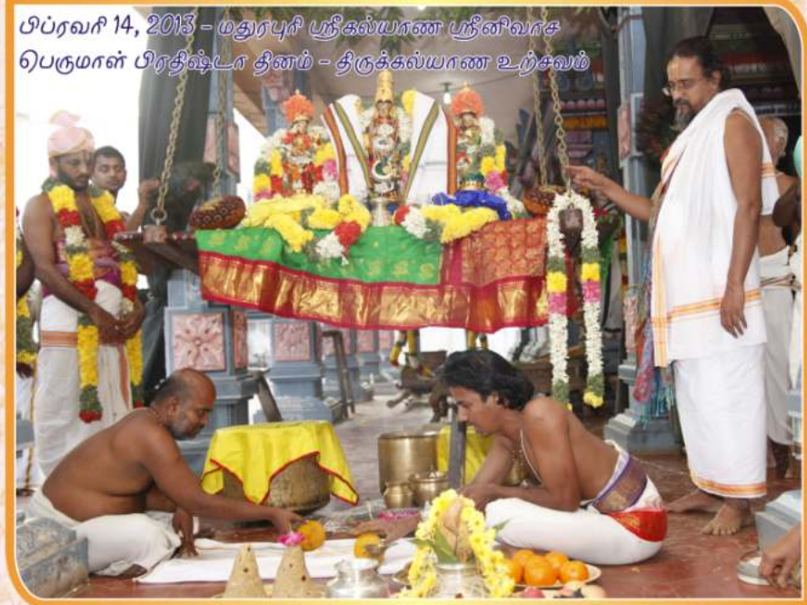
பிப்ரவரி 14, 2013 - மதுரபுரி ஸ்ரீகல்யாண ஸ்ரீனிவாச பெருமாள் பிரதிஷ்டா தினம் - திருக்கல்யாண உற்சவம்