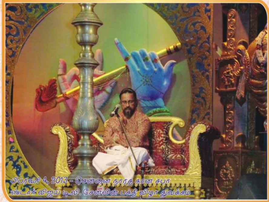
பிப்ரவரி 4, 2013 - சென்னை நாரத கான சபா ஸ்டார் விஜய் டி.வி. சேனலின் பக்தி விழா துவக்கம்